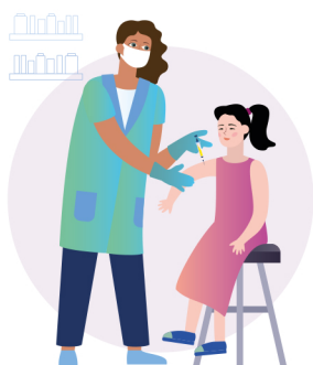
Вакцинировать подростков против ВПЧ

Чтобы защитить женщин от разрушительных последствий рака шейки матки, ВОЗ призывает: