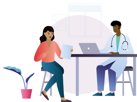
Регулярно проводить скрининг женщин на рак шейки матки и качественное лечение